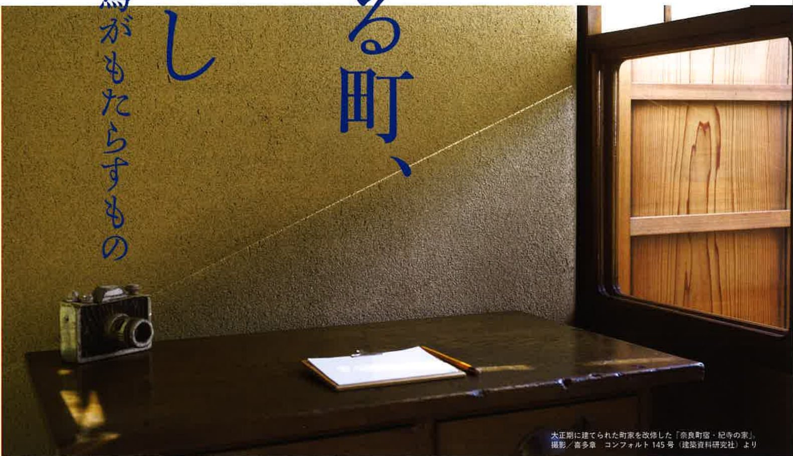
大正期に建てられた町家を改修した「奈良町宿・紀寺の家」

つい30年くらい前まで、日本の壁といえは左官の壁だった。庶民の家もお金持ちの家も、そば屋も旅館も、学校や役所だって、左官が壁を塗っていた。それらが急速に姿を消していった。多くの左官は廃業し、後継者はいなくなっていく。はたして、左官はもう終わりなのか？日本人はもう左官を必要としていないのか？ 日本左官会議の連続シンポジウム。一緒にお考えいただけたら幸いです。